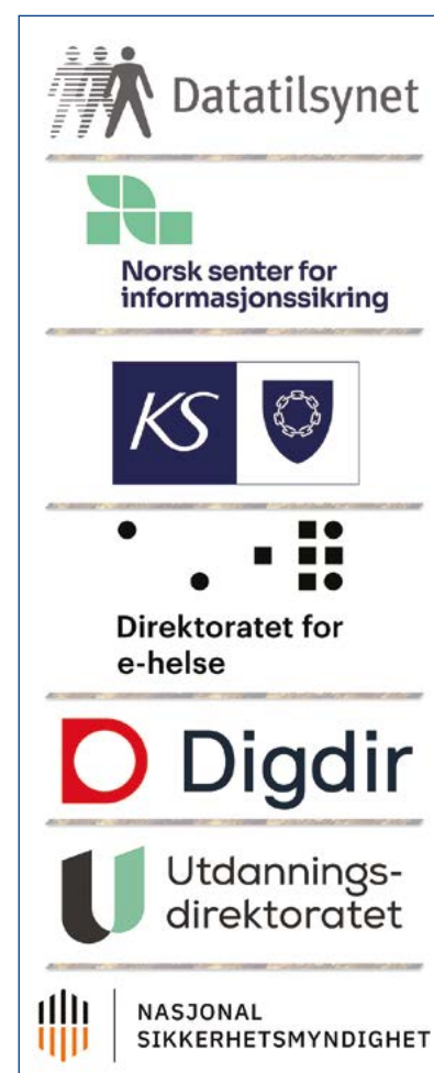
Nære samarbeidspartnere av KiNS