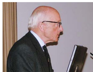
Kåre Willoch på KiNS-konferansen på Lillehammer i 2004.

Ser vi på styresammensetningen frem til 2008 er kommuner og næringsliv fordelt med hhv. 3 og 2 styremedlemmer. Fra 2008 er styret sammensatt av representanter bare fra kommuner og fylkeskommuner. Dette gjelder fortsatt i jubileumsåret 2023, dog med en presisering i vedtektene i 2009 om at styremedlemmene «skal ha bakgrunn fra arbeid med informasjonssikkerhet i kommune eller fylkeskommune.»