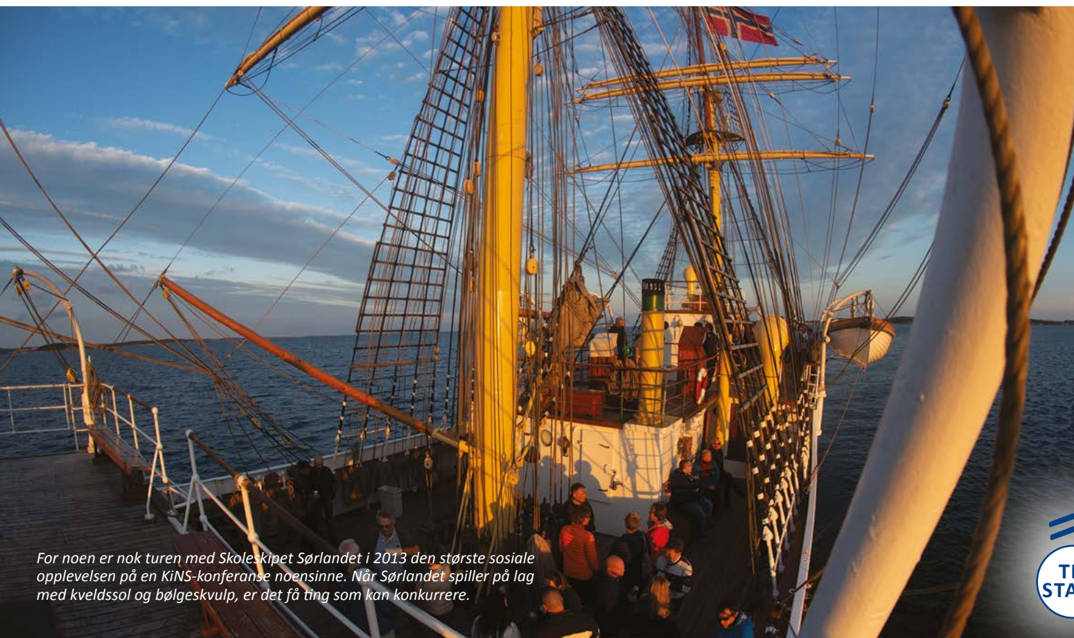
For noen er nok turen med Skoleskipet Sørlandet i 2013 den største sosiale opplevelsen på en KiNS-konferanse noensinne. Når Sørlandet spiller på lag med kveldssol og bølgeskulp, er det få ting som kan konkurrere.

Den nye direktøren i Datatilsynet fikk æren av å åpne KiNS-konferansen i 2011 (og siden har han vært der). >>>