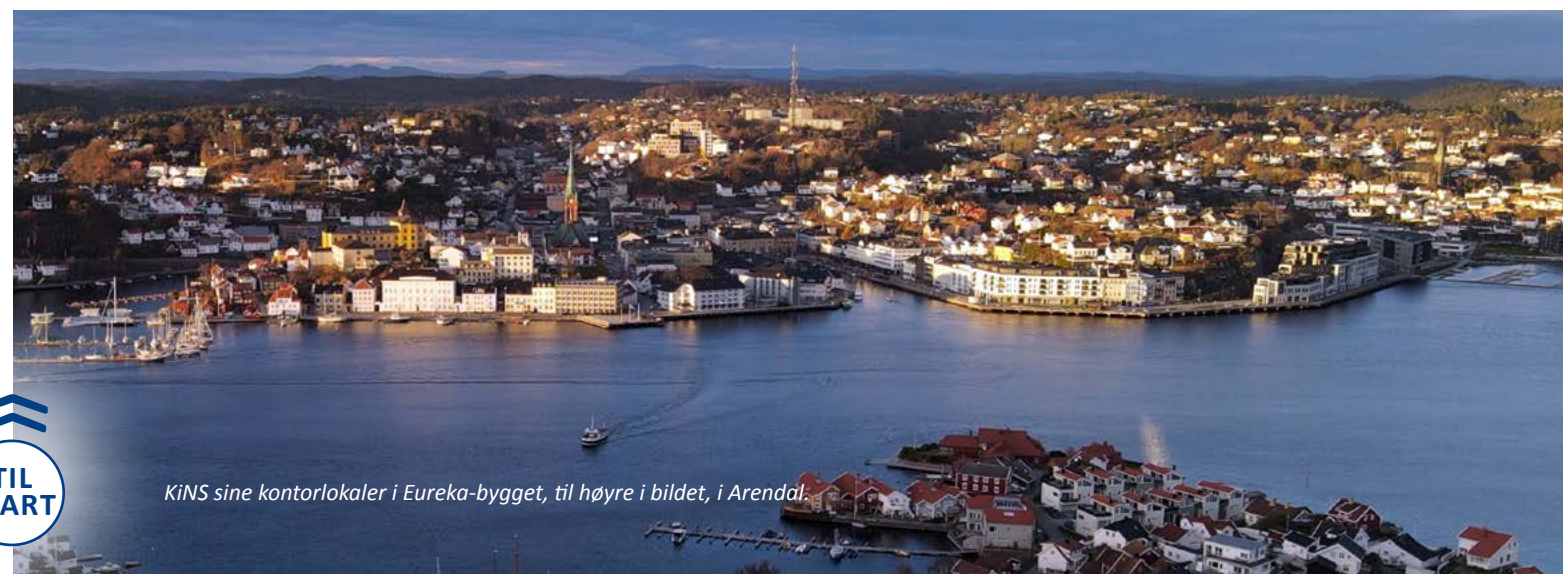
KiNS sine kontorlokaler i Eureka-bygget, til høyre i bildet, i Arendal.